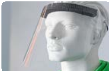
Jederzeit klare Sicht