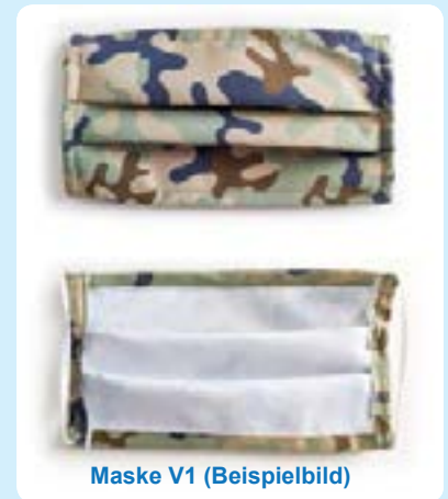
Maske V1 (Beispielbild)