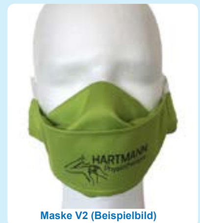
Maske V2 (Beispielbild)