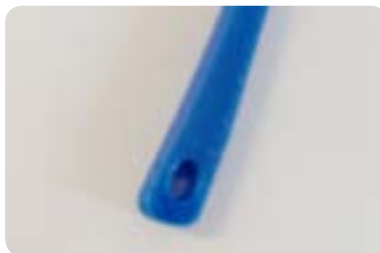
Ösen für Gummiband (optional)