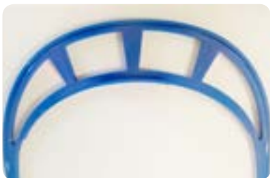
Belüftung im Stirnbereich

Weitere Stückzahlen auf Anfrage. Preise inkl. MwSt., zzgl. Versand.